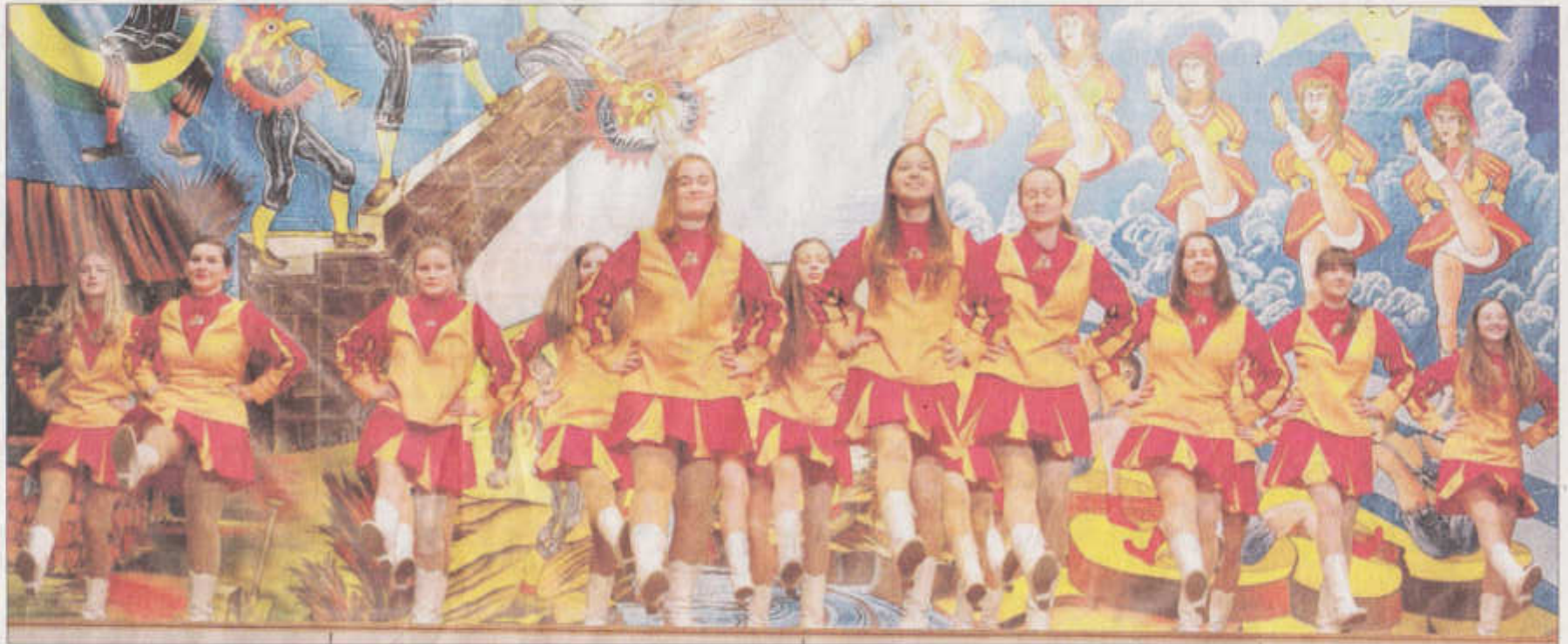
Der Auftritt des Bachdatscherballetts ist stets einer von vielen Höhepunkten beim großen Fest der Welschensteinacher Zunft.

Zahlreiche Gastzünfte: Zum Fest werden mehr als 600